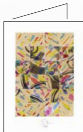
biglietto n. 2 Il tempo

La stella che brilla costantemente nel firmamento attraverso il testo di una nota canzone inglese inteso a trasmettere anche un segno universale di fiducia e di speranza nell'avvenire.