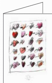
biglietto n. 3 Il cuore

L'orologio raffigurato da un quadrante scomposto nelle variegate tessere di un mosaico significa la complessità della ricerca scientifica e i suoi lunghi tempi di percorrenza.